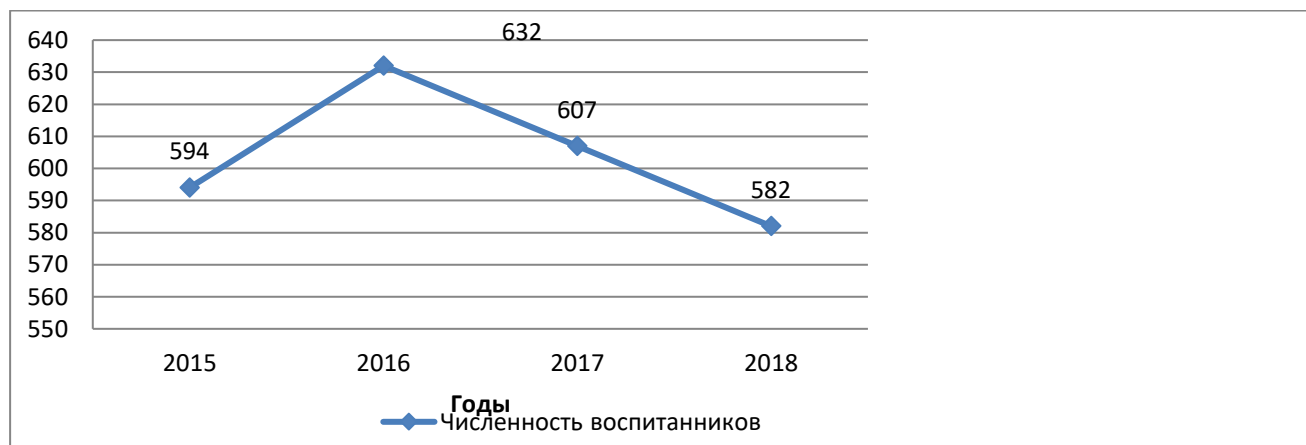
Рисунок 1 – Численность воспитанников образовательных организаций, осуществляющих образовательную деятельность по образовательным программам дошкольного образования, в чел.

Охват детей дошкольным образованием в возрасте от 2 месяцев до 7 лет – 40,6% (от 2 месяцев до 3 лет – 6,6%)